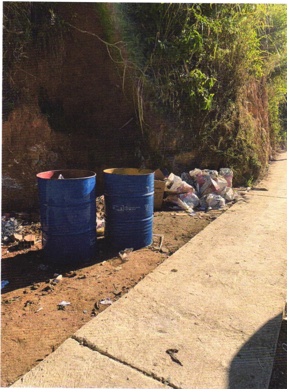
Rua Doutor Felício dos Santos